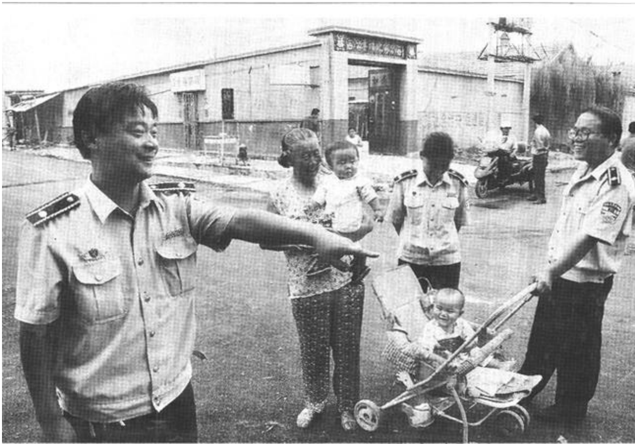
东营区辛店街道认真落实城市改造规划，近年来，共投资1800万元，协调资金450万元，用于北二路改造、淄博路西延和城中村的水、电、路、讯的修整改造，有效地解决了垃圾不入箱、臭水外淌等脏乱差现象，极大地方便了广大居民的生产生活。